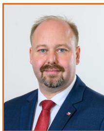
JUDr. Jeroným Tejc ministr spravedlnosti České republiky